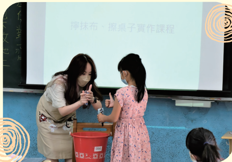
志工帶領小朋友練習 擦抹布的技巧