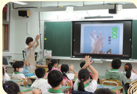
洗手衛教也是課程中 重要的一環